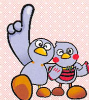
埼玉県マスコット 「コバトン」「さいたまっち」

この講座は、発達障害総合支援センターが実施する人材育成研修の受講者等が 支援者として一緒に参加又は見学をしますので、ご了承ください。